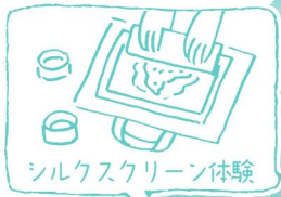
シルクスクリーン体験