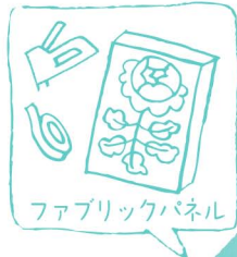
ファブリックパネル

長屋を再生させたレトロな建物へ卒Vのショップ達が いっせいにワークショップを開催します。 いくつも体験できるスペシャルデーで新年のスタートを!